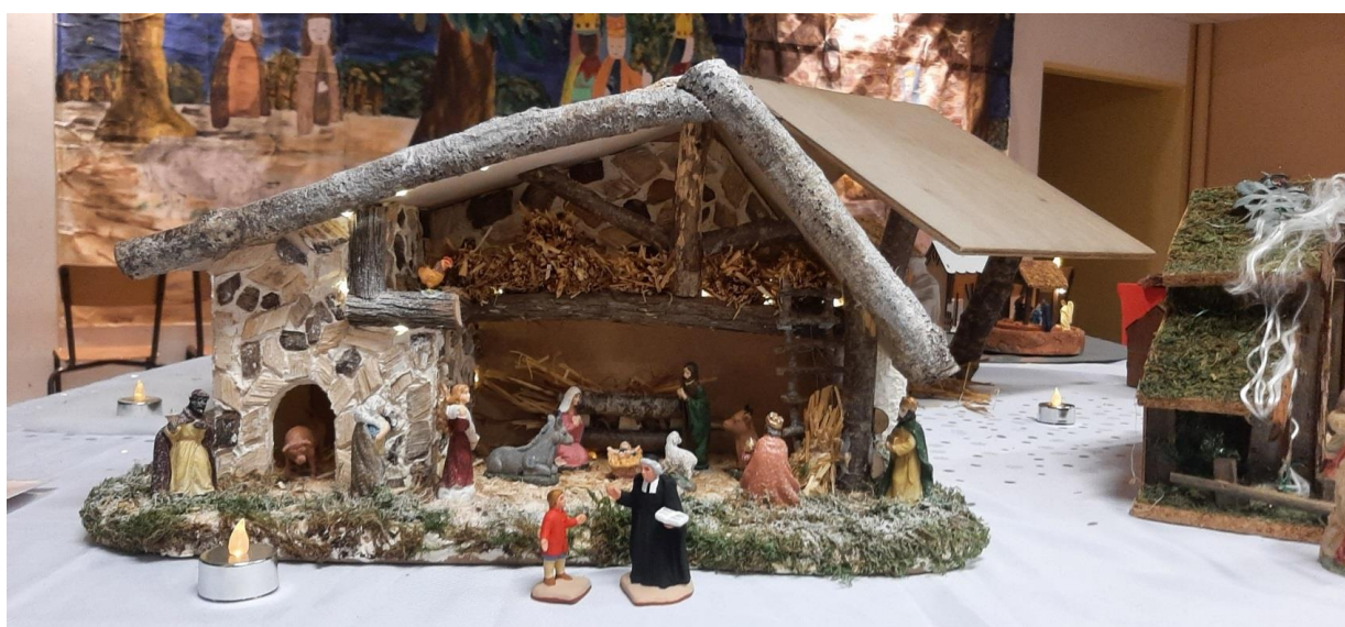
Et même avec St Jean Baptiste de La Salle et un élève ....